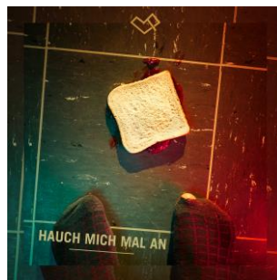
„Hauch mich mal an“ Single VÖ 05.04.2019