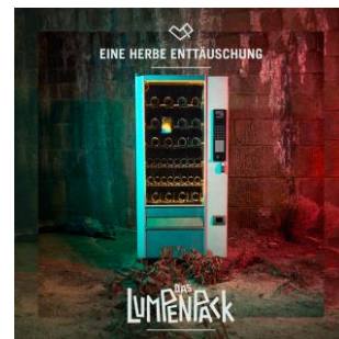
„Eine herbe Enttäuschung“ Album VÖ 09.08.2019